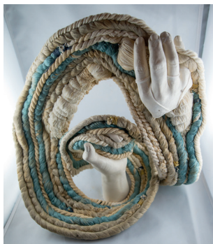
Embrase I - 2019 - textile bleu, beige, or, plâtre 20 x 35 x 15 cm ..... 420 €