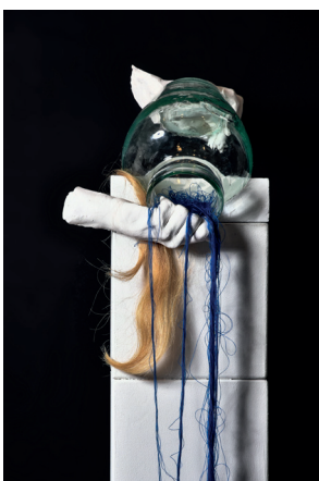
La Source - 2017 - plâtre, verre, fil, cheveux 20 x 100 x 20 cm ..... 300 €