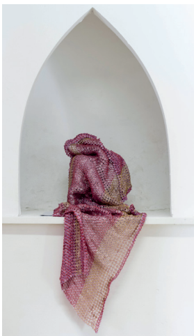
Drapé - 2015 - boutons, fils aluminium 130x40 cm .....1 350 €