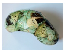
La Forme - 2019 - divers matériaux 16 x 8 x 7 cm ..... 80 € - 120 € - 180 €