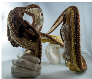
Embrase III - 2019 - textile marron, jaune, beige, plâtre 27 x 22 x 20 cm ..... 370 €