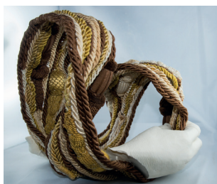
Embrase II - 2019 - textile marron, jaune, beige, plâtre 25 x 26 x 20 cm ..... 370 €