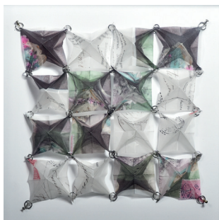
1906 - 2018 - papier calque imprimé, rondelles d'acier - 25 x 25 cm ..... 200 € - 15 x 15 cm ..... 150 €