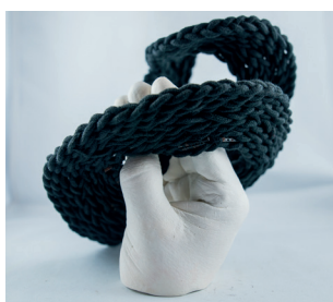
Embrase IV - 2019 - lacets noirs tressés, plâtre 17 x 15 x 12 cm ..... 180 €